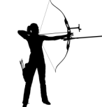
TIR A L'ARC